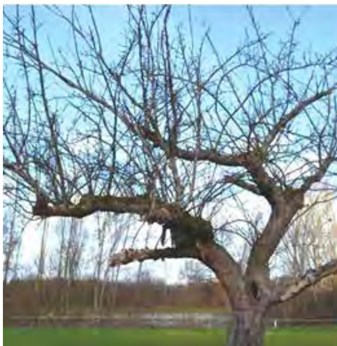
Bild 3: vor dem Pflegeschnitt