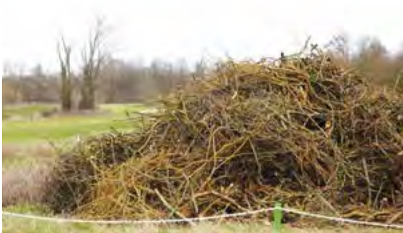
Bilder 12 bis 15: Totholzaufschichtung – Lebensraum für Pflanzern und Tiere

es notwendigen Lebensraum bietet für eine Vielzahl von Tieren und Pflanzen und so für ein gesundes Gleichgewicht in der Natur sorgt.