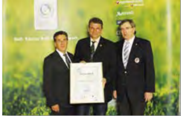
13. April 2013 Feierliche Überreichung: DGV Zertifikat in Gold